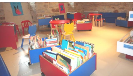
A.G. année 2014 - HS